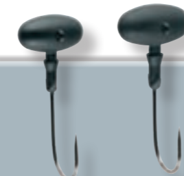
3/4 OZ - 21 g LERS 9530008 1 OZ - 28 g LERS 9530010